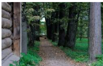
Аллея в сторону Молодого сада

сереньком камзоле с звездой и в круглой шляпе и с костылем в руке... Князь прошел в аллеи и, заложив руки назад, стал ходить. Музыка играла».