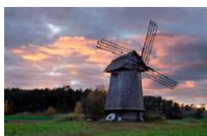
Старая ветряная мельница

В прежние времена на горке стояла крепость, а дозоры день и ночь сторожили синюю даль: граница была близко.