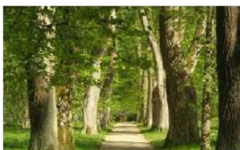
Липовая аллея Анны Керн

В Тригорском – замечательный парк. В нём есть «аллея Татьяны» и огромный старый дуб – «лукоморье».