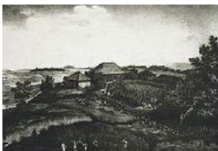
Усадьба Михайловское в 1837 г.,