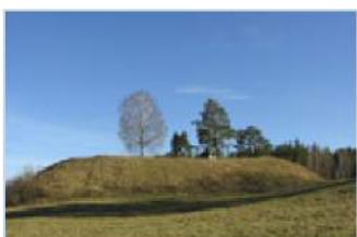
Городище Савкина горка

На обрыве над Сортью стоит белая скамья, её прозвали «Скамьей Онегина» , отсюда высматривали: не скачет ли Пушкин.