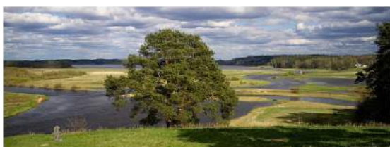
У Лукоморья дуб зелёный

Анне Керн Пушкин посвятил своё знаменитое стихотворение «Я помню чудное мгновение»