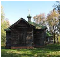
Церковь Александра Невского