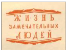
до 1945 года

За время своего существования эмблема серии «ЖЗЛ» несколько раз видоизменялась.