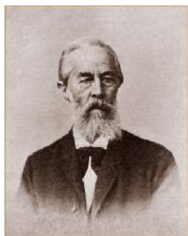
Фридрих Арнольд Брокгауз

Значительно дополненное и переработанное второе издание «Малого Словаря» является наиболее полной, общедоступной и удобной для использования справочной книгой по всем отраслям знаний. Новое издание «Малого Словаря» иллюстрировано хромолитографиями и многими географическими картами и таблицами рисунков.