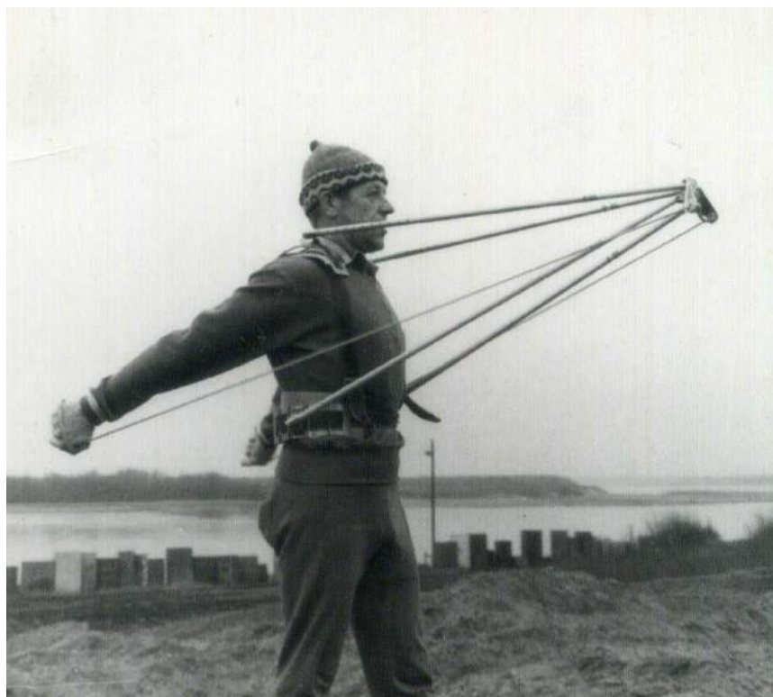
Устройство для развития силы мышц