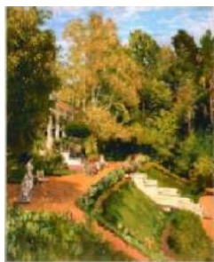
Художник И.Е. Репин

В 1870 году в подмосковном селе Абрамцево Мамонтов приобрёл у вдовы писателя К.С. Аксакова опустевший дом . Живописный парк, река вдохновляли в своё время писателя и его многочисленных гостей. В 1850-1860-х гг. здесь бывали Н.В. Гоголь, И.С. Тургенев, Т.Г. Шевченко и многие другие известные люди.