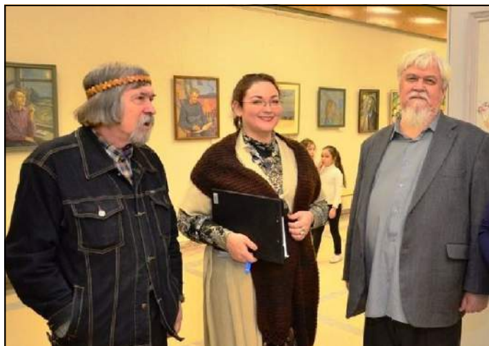
Выпускники ДДХШ разных лет.