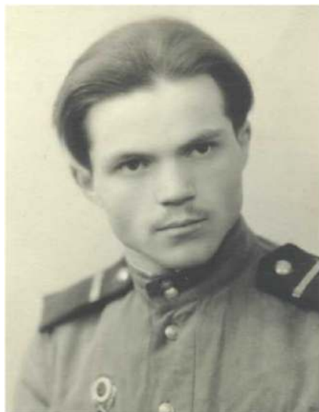
Молодые годы – служба в армии