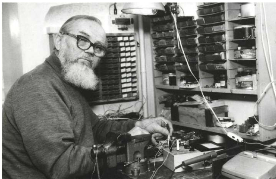
Мастер на все руки, 80-е годы