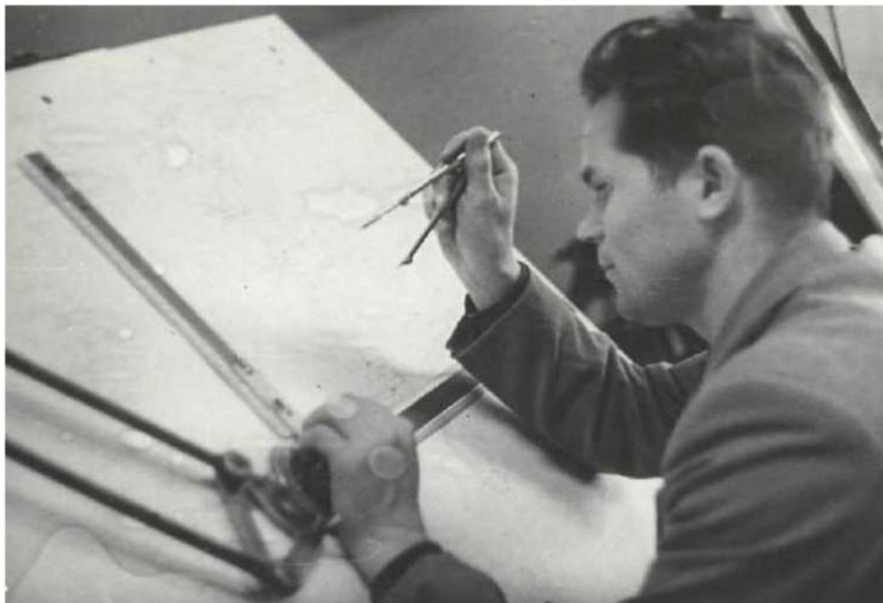
Работа на РМЗ в должности техника-конструктора с дипломом журналиста