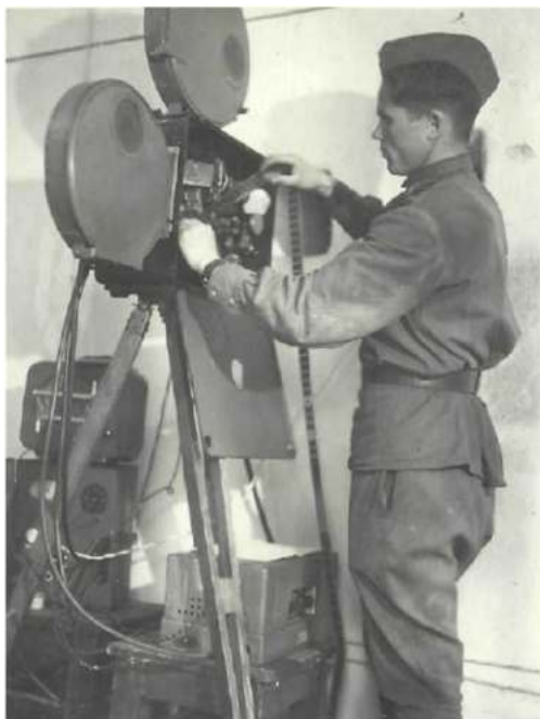
Кинемеханик (солдатская обязанность)