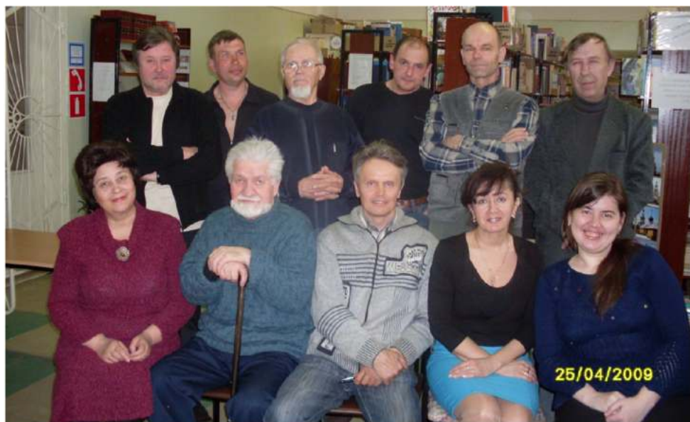
Городской литературный клуб «Поиск»

1. Город глазами фоторепортёра Петра Дмитриевича Бармина [Видеозапись] / [рук. проекта В. Н. Прокашев ; авт. гр.: Е. Н. Загайнова, В. Л. Северюхин, М. С. Загайнов, Н. И. Созонтова, Н. Л. Романова]. – Кирово-Чепецк, 2013 : 30.04 мин. – Формат MP4.