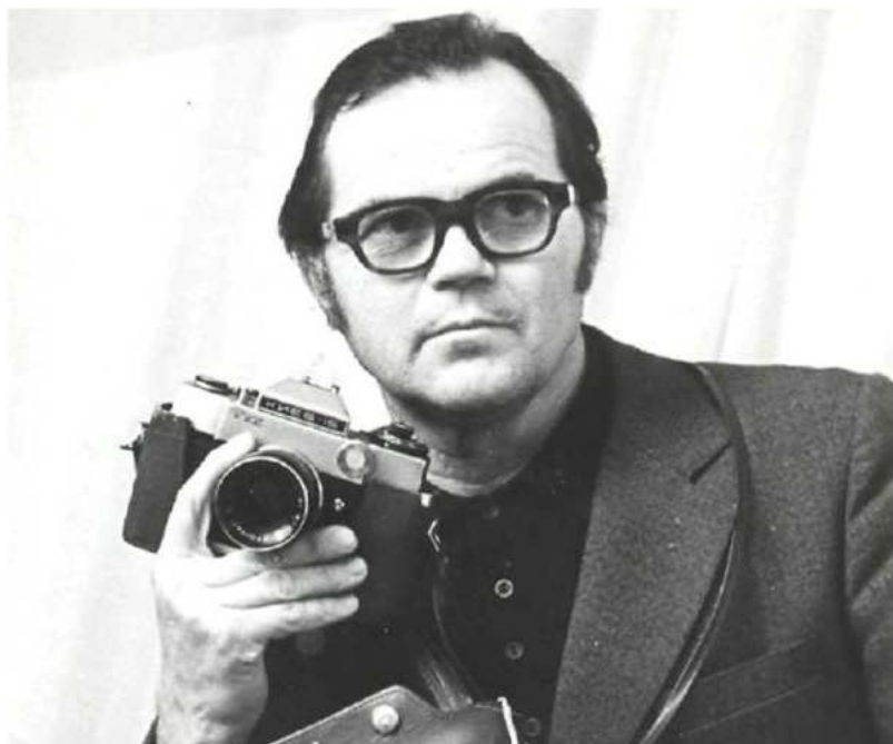
Молодой фотокорреспондент, 60-е годы