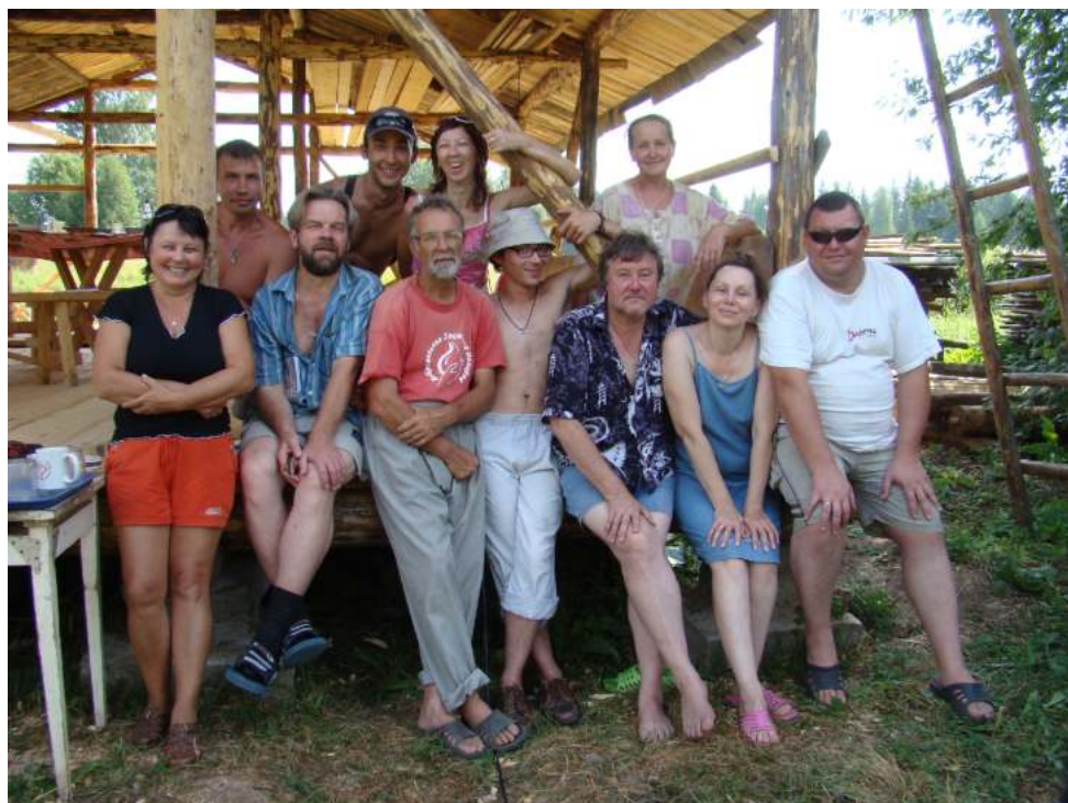
Творческая компания в Шатках