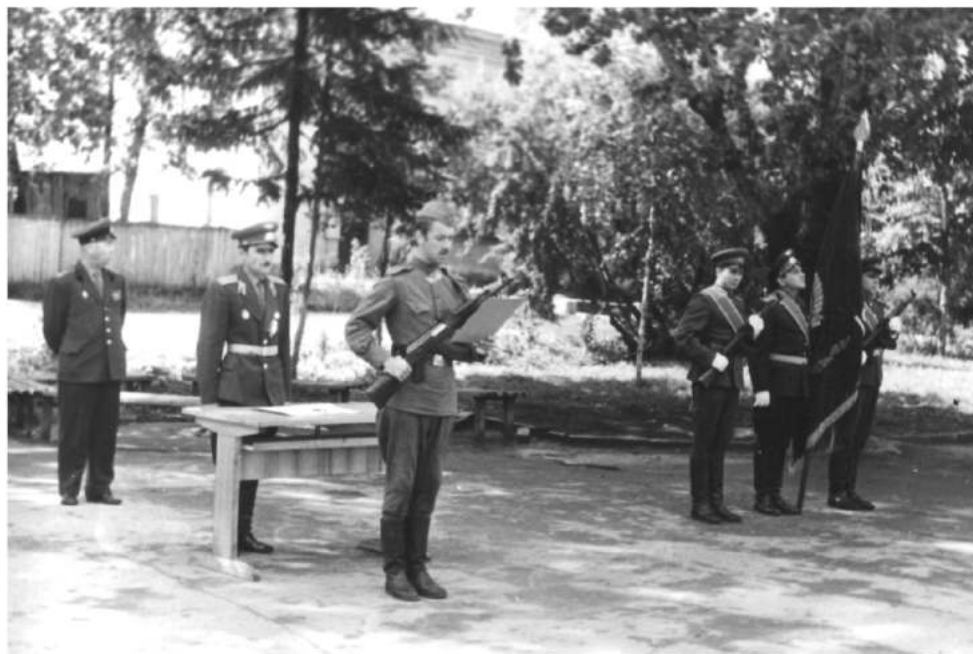
Служба в армии. 20 лет