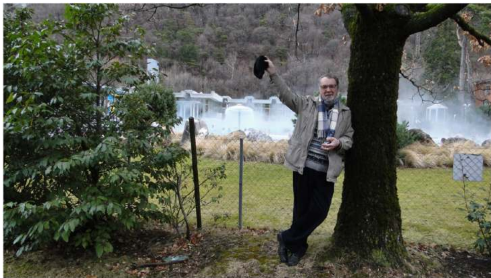
Путешествие в Швейцарию, 2011 г.