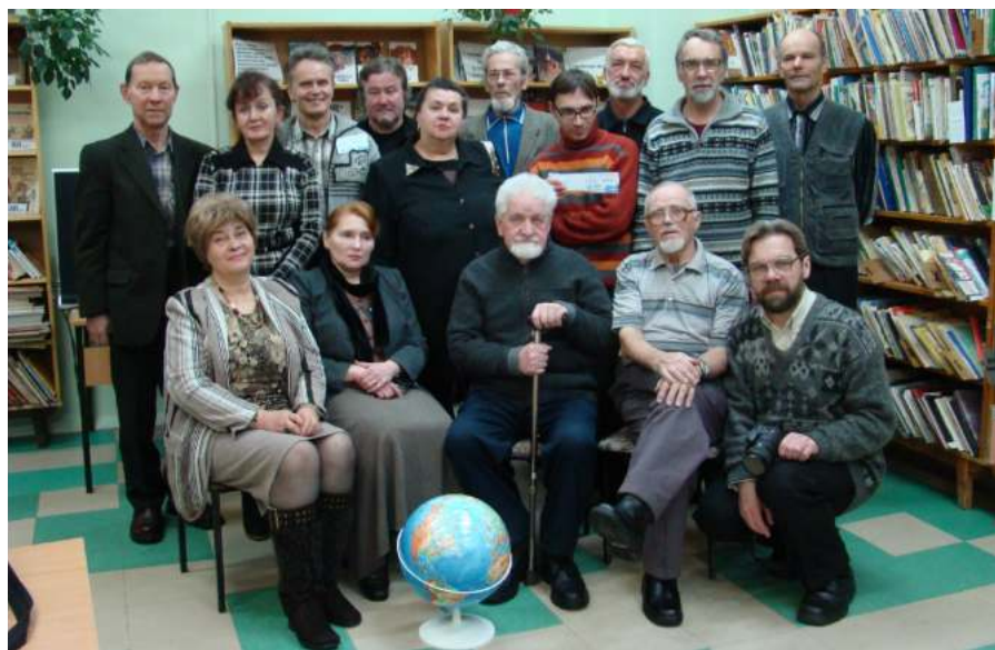
Городской литературный клуб «Поиск»