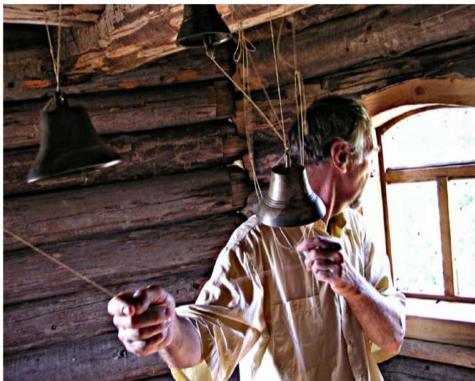
Под звон колоколов (часовня в д. Шатки)